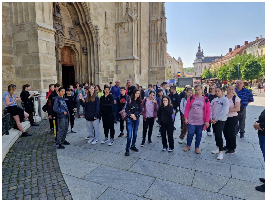
Utunk végéhez közeledve Királyhágón Erdély kapujában megtekintettük a panorámát.