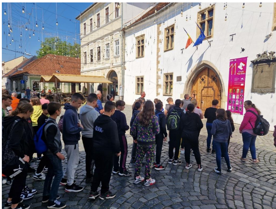
a Szent Mihály templomot.